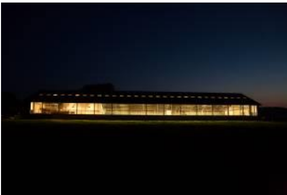
Figuur 1 zicht op een stal met open stalgordijn

Hieronder worden de twee situaties beschreven: situatie met open stalgordijn en situatie met gesloten stalgordijn.