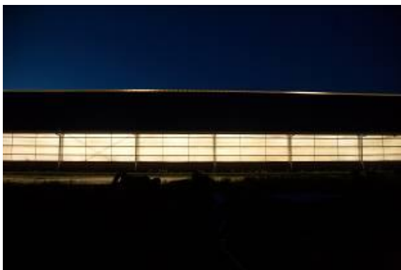
Figuur 2: zicht op een stal met gesloten stalgordijn

Stalgordijn open: het licht komt van de lampen, straalt op alle oppervlakken in de stal en wordt gedeeltelijk naar buiten gestraald. De verlichte binnenkant van de stal is van buiten te zien: muren, onderkant dak, koeien, buizen etc. Dicht genoeg bij de stal zijn de lampen zelf te zien.