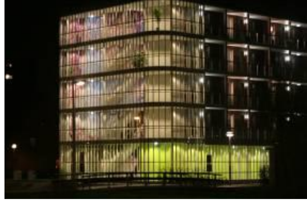
Figuur 4: flat in Utrecht