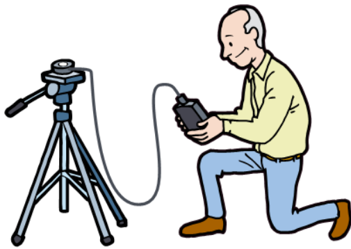
schematisch voorbeeld horizontale lichtmeting

Ook dient de meetcel niet dicht bij het lichaam gehouden te worden omdat afhankelijk van de kleur van de gedragen kleding de meetwaarde hierdoor positief dan wel negatief beïnvloed wordt. Het beste kan, net als op de afbeelding, de meetcel op een statief worden geplaatst waarbij een knielende houding wordt aangenomen. Hierdoor wordt er zo min mogelijk verstoring van het invallende licht gemeten.