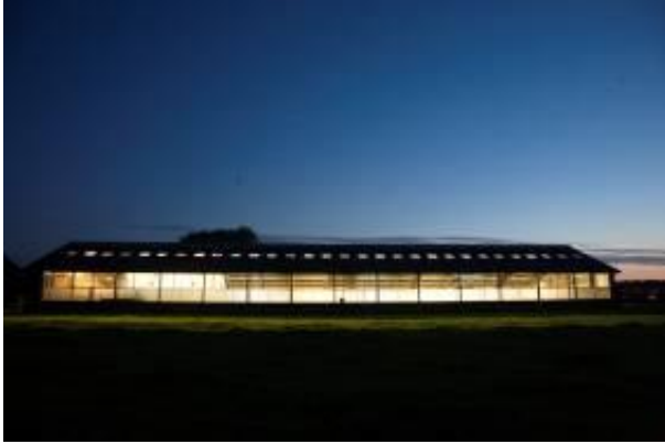
Figuur 3: melkveestal in Groningen

De verlichting van een melkveestal is vergelijkbaar met veel andere bouwwerken. Een melkveestal lijkt op hoe een parkeergarage verlicht wordt, of zelfs een modern kantoor met veel glas. In een kantoor is de verlichtingssterkte vergelijkbaar met die in een stal. Het licht van kantoren schijnt door glas of gordijnen naar buiten, terwijl het bij stallen direct of indirect via het stalgordijn naar buiten schijnt.